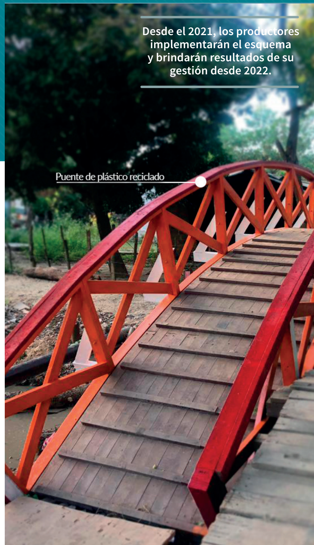
Puente de plástico reciclado

Desde el 2021, los productores implementarán el esquema y brindarán resultados de su gestión desde 2022.